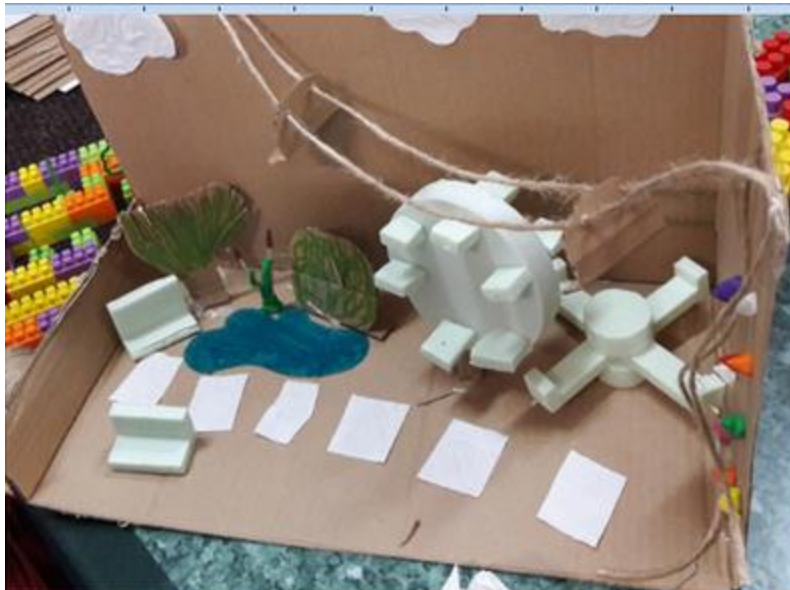
Strefa aktywności rodzinnej