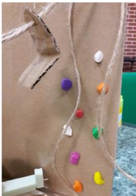
Ścianka wspinaczkowa i park linowy

Brakującą funkcją, którą uczestnicy animacji uznali za konieczną do zaprojektowania jest również funkcja atrakcji skierowanych do rodzin z dziećmi. Projekt zakłada utworzenie strefy aktywności rodzinnej w formie parku rozrywki z uwzględnieniem montażu parku linowego i wewnętrznej ścianki wspinaczkowej.